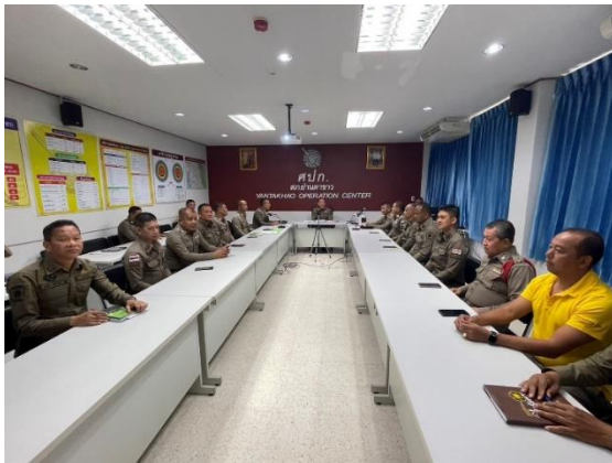
แบบวัดการรับรู้ของผู้มีส่วนได้ส่วนเสียภายนอก (EIT) สภ.ย่านตาขาว จ.ตรัง(301366)